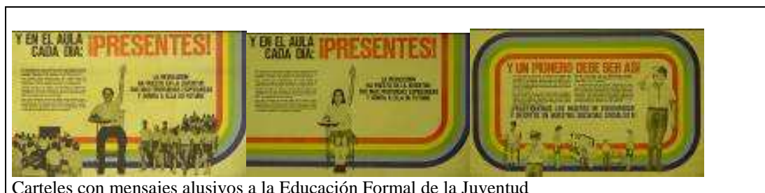
Carteles con mensajes alusivos a la Educación Formal de la Juventud

Igualmente desde mediado de los años setenta para dar continuidad a la labor de crear convicciones socialista __ simultáneamente con los carteles resultados de las campañas específicas del proceso de institucionalización__ también se editaron los reveladores de mensajes, como: “ Y en el aula cada día; Presentes! ” y “ Un pionero debe ser así ” que formaron parte de las campañas de la Educación formal y social de la juventud y el Cuidado de la propiedad social. En la ejecución de estas temáticas todas con el propósito de resaltar los valores del socialismo se acudió al empleo del cartel mural con textos extensos apoyado en la fotografía testimonial.