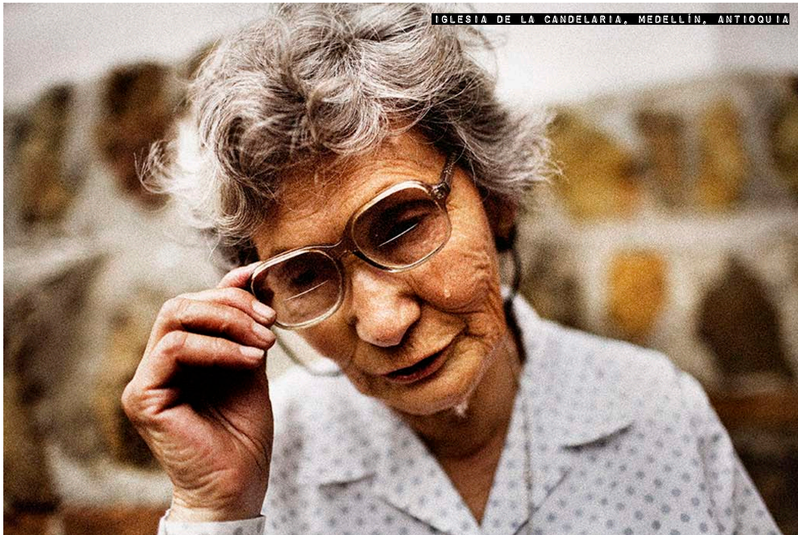
IGLESIA DE LA CANDELARIA, MEDELLÍN, ANTIOQUIA